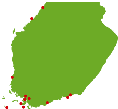
Kuva 1. Suomen rantaroskan seurantarannat

ohjeita. Seurantamenetelmä perustuu rannoilla tehtäviin seurantasiivouksiin. Tällä hetkellä näitä seurantarantoja on kolmeitoista (ks. kuva 1), näistä pohjoisin on Kalajoella ja itäisin Kotkassa. Suomen rantaroskaseurantaan kuuluu urbaaneja, luonnontilaisia sekä näiden välimuotoa edustavia merenrantoja. Seurantasiivouksessa löydetyt roskat lasketaan kappaleina kahdeksaskymmenessä eri roskakategoriassa.